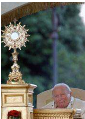
Juan Pablo II, en su última procesión del Corpus Christi , en el año 2004.