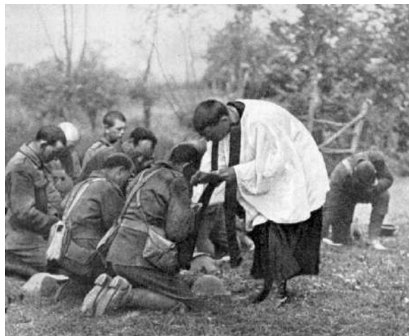
Comunión en el frente, durante la Guerra Mundial